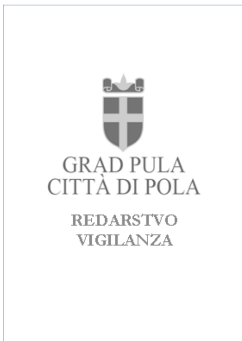
Prilog 2. Grafički izgled prednje strane kožnog poveza