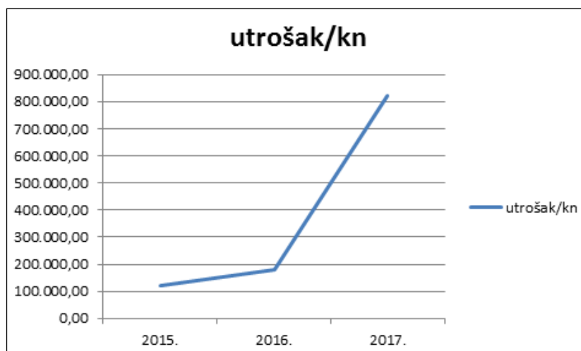
Graf 3. Prikaz utroška sredstava za sanaciju lokacija odbačenog otpada na području grada Pule u periodu od 2015. do 2017. godine