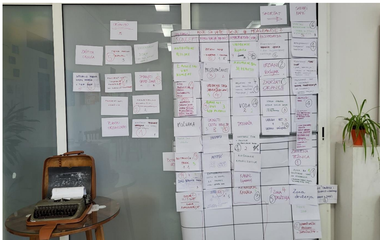
Slika 5. Rezultati radionice

Zaključno, nevezano za „broj bodova“, sadržaji i teme koji su se istaknuli su: