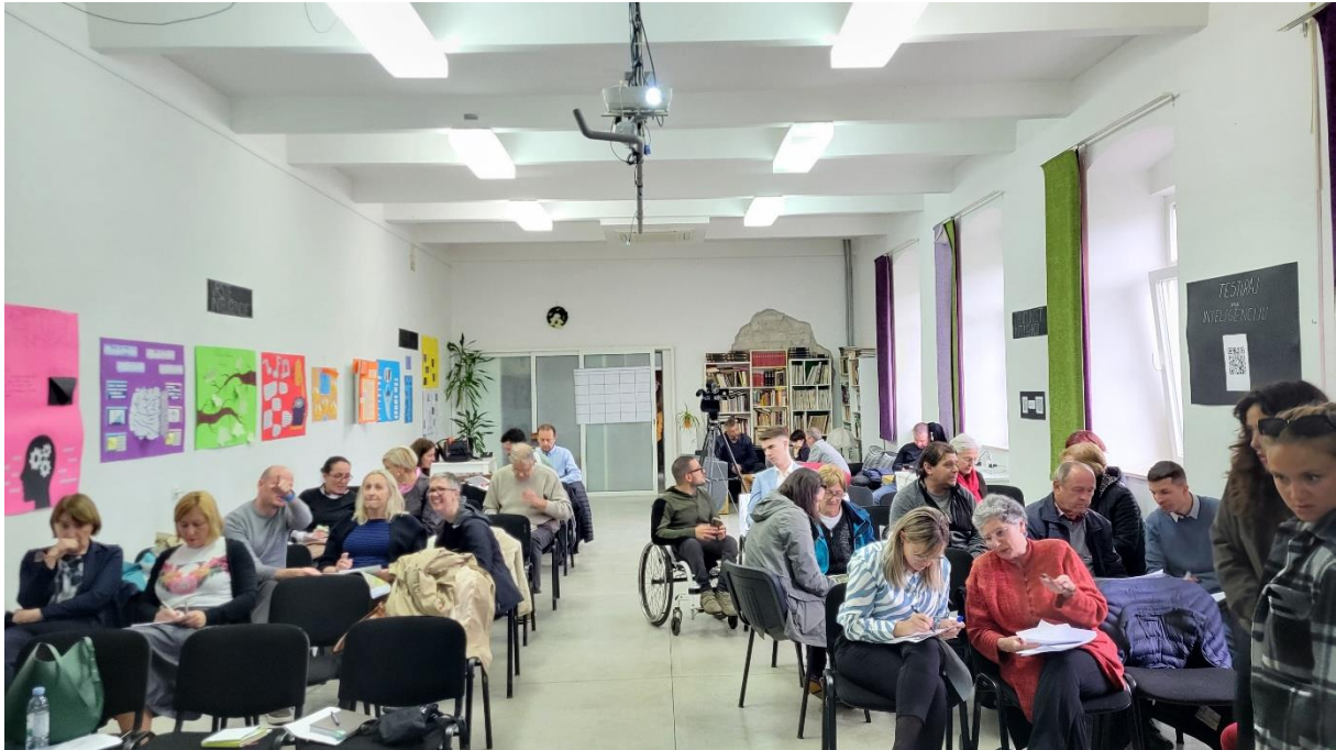
Slika 1. Participativna radionica s građanima