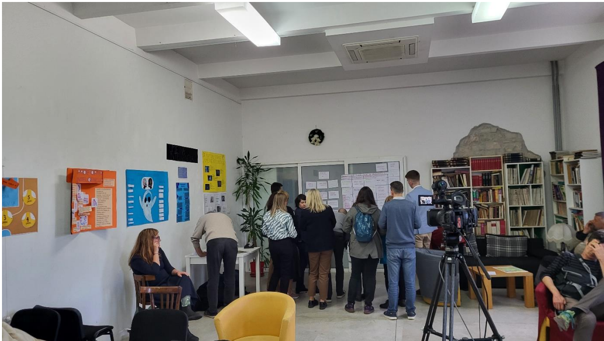
Slika 4. Radionica s građanima

Radionica je temeljena na pretpostavci da sudionici dolaze s bogatim fondom ideja, što se pokazalo točnim. U uvodu radionice predstavljeni su ciljevi projekta. Kroz radionicu su filtrirane i prioritizirane ideje za uređenje zelene zone Pragrande pomoću suvremenog alata Opera . Opera je metoda timskog rada koja poboljšava učinkovitost sastanaka. Ova metoda fokusira energiju rada grupe na konkretan problem ili pitanje, skuplja, filtrira i sažima prijedloge na strukturiran način. Objedinjuje sistematičan način razmišljanja s kreativnim procesom u rješavanju problema te tako omogućava najučinkovitije iskorištavanje znanja sudionika u procesu, koristi njihova znanja i prijedloge te ne dopušta ekstrovertiranim sudionicima da preuzmu diskusiju.