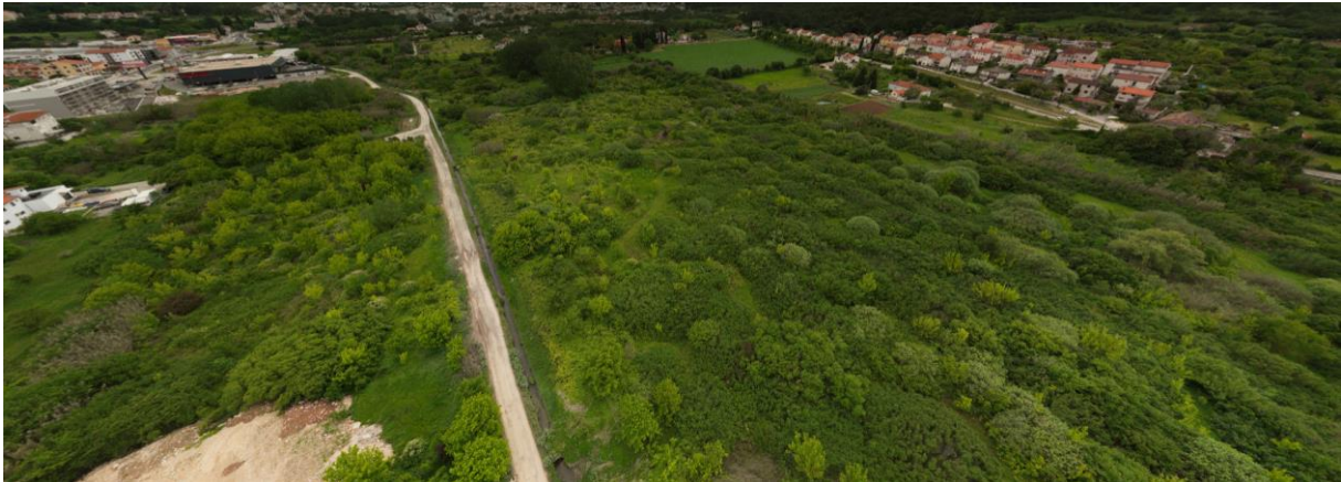
Slika 2. Prikaz prostora Pragrande iz zraka

Zona Pragrande u Puli je zapuštena zelena oaza površine Pcca=26ha. Iako nepoznata mnogim građanima Pule, dio stanovnika ju poznaje i koristi, a posebno ju je prepoznao kao veliki potencijal unutar urbane zelene infrastrukture. Ovo veliko neiskorišteno bogatstvo grada Pule prepoznala je i gradska uprava te ga planira urediti i privesti svrsi kao novi javni prostor grada. Kako bi se osiguralo najbolje moguće rješenje, Grad Pula planira raspisivanje javnog urbanističko-krajobrazno-arhitektonskog natječaja za izradu idejnog rješenja uređenja zelene zone Pragrande koje će provesti Društvo arhitekata Istre. Program natječaja izrađuju krajobrazna arhitektica Ines Hrdalo i arhitektica Maja Kireta. U svrhu prikupljanja informacija od svih relevantnih dionika, u fazi pripreme programa, u četvrtak 25.4.2024. provedene su dvije radionice s relevantnim dionicima.