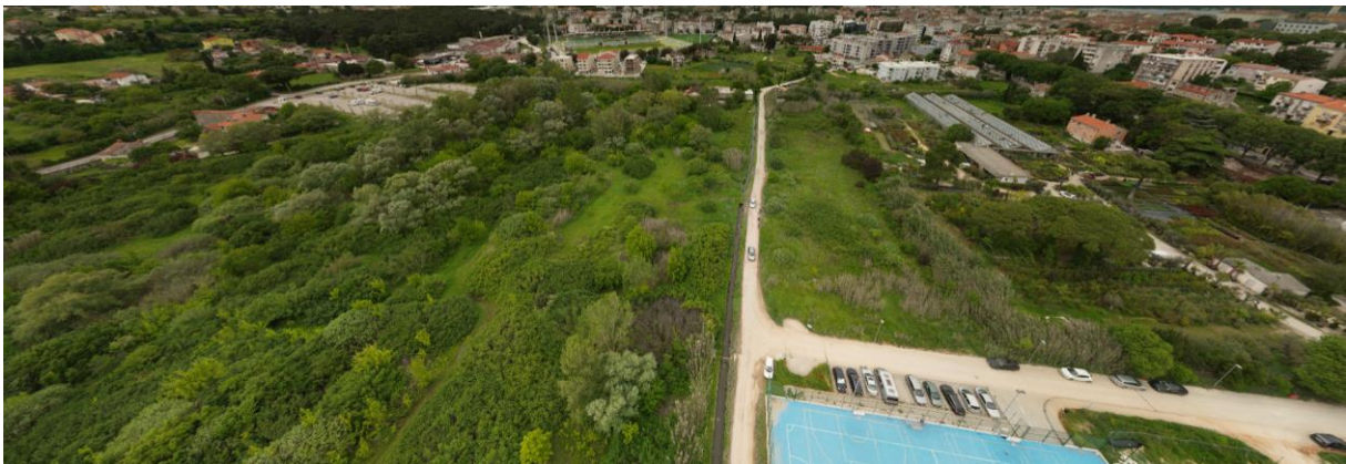
Slika 3. Prikaz povezanosti zelene površine Pragrande s urbanim tkivom