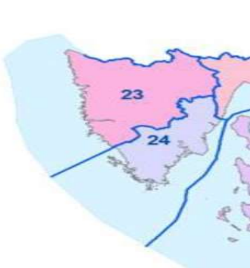
(slika broj 1.)

Člankom 26. određeno je uslužno područje broj 24 koje obuhvaća gradove Labin, Pula – Pola i Vodnjan – Dignano, te općine Barban, Fažana – Fasana, Kršan, Ližnjan – Lisignano, Marčana, Medulin, Pićan, Raša, Sveta Nedjelja i Svetvinčenat u Istarskoj županiji. Iznimno od navedenog, uslužno područje 24 ne obuhvaća dijelove naselja Kukurini, Montovani, Orič, Pićan i Sveta Katarina iz Općine Pićan, koje spadaju u uslužno područje 23 (navedeno u prethodnom odlomku ovog obrazloženja Odluke). Uslužno područje 24 obuhvaća i naselje Škopljak i dio naselja Gračišće (Žlepčari) iz Općine Gračišće te naselje Gologorički Dol iz Općine Cerovlje u Istarskoj županiji. Zaključno, spomenuta Uredba propisuje da je društvo preuzimatelj na navedenom uslužnom području broj 24 - Vodovod Pula d.o.o., Pula.