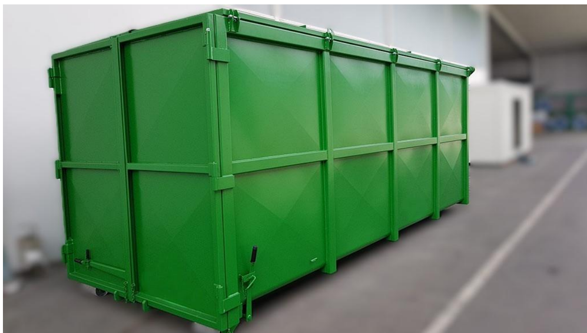
Slika 7: primjer zatvorenog abroll kontejnera velikog volumena