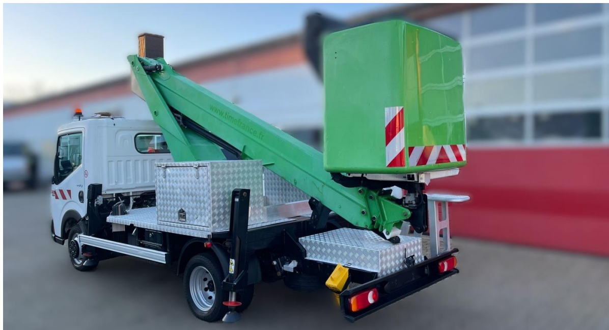
Slika 1: Primjer autokošare