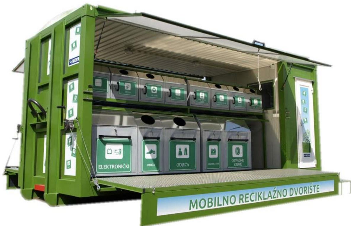
Slika 6: primjer mobilnog reciklažnog dvorišta na abroll sustavu