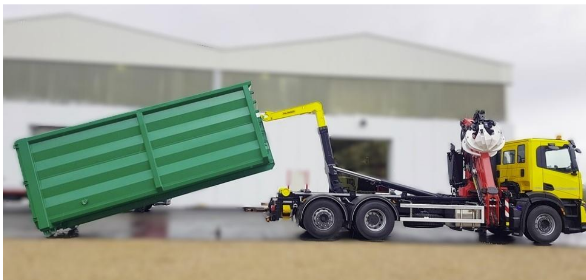
Slika 4: Primjer navlakača sa dizalicom opremljenom grablicom i abroll sustavom