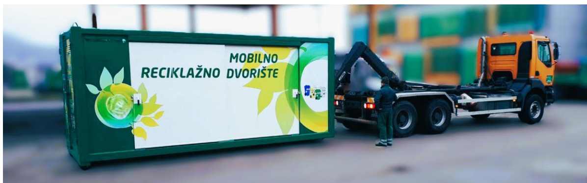
Slika 5: primjer iskrcanja mobilnog reciklažnog dvorišta na abroll sustavu