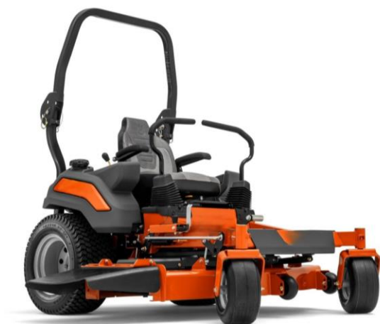
Slika 2: Primjer kosilice s okretajem u mjestu