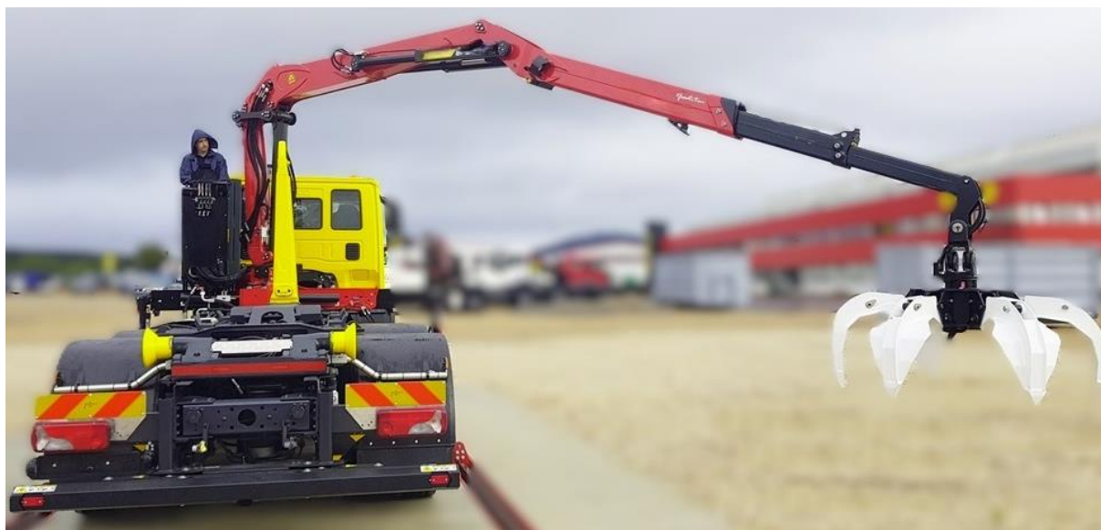
Slika 3: Primjer navlakača sa dizalicom opremljenom grablicom i abroll sustavom