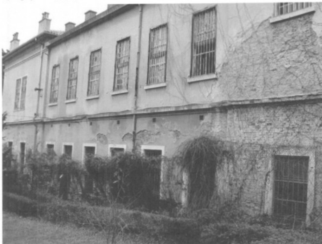
Psihijatrija u Puli (N. V.)

Inner Wheel Club Pula objavio je rezultate uspješno održanog 14. dobrotvornog koncerta koji je u Domu hrvatskih branitelja održan 29. svibnja. Zahvaljujući od srca svima koji su bezrezervnom podrškom IWC-u Pula pomogli ostvariti cilj ovogodišnjeg dobrotvornog koncerta, a to je donirati potrebnu opremu Djelatnosti za psihijatriju Opće bolnice Pula, ističu da su prihodovali ukupno 43.370 kuna