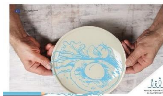
Pomoć se pruža, a ne zamišlja!