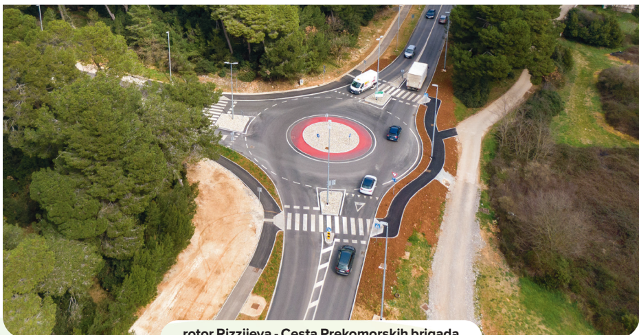
rotor Rizzijeva - Cesta Prekomorskih brigada