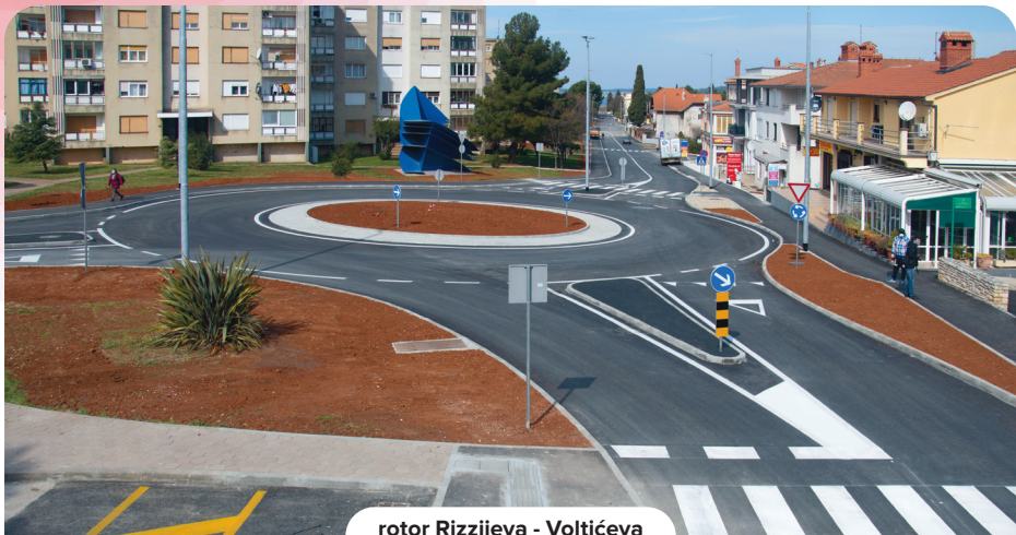
rotor Rizzijeva - Voltičeva