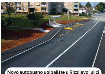
Novo autobusno ugibalšte u Rizzijevoj ulici