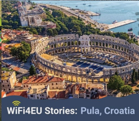
WiFi4EU Stories: Pula, Croatia