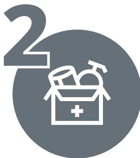
KOMPLET ZA PREŽIVLJAVANJE