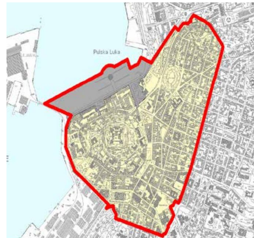
Obuhvat PUP - a "Stari Grad Pula" - sivom bojom područje koje je stavljen izvan snage Odlukom o stavljanju izvan snage dijela Provedbenog urbanističkog plana „Stari Grad Pula" ("Službene novine" Grada Pule br. 05/17)

Dio područja PUP - a "Stari Grad Pula" koji je bio unutar obuhvata II ciljanih Izmjena i dopuna Prostornog plana uređenja Grada Pule, I. ciljanih Izmjena i dopuna Generalnog urbanističkog plana Grada Pule i obuhvata UPU "Riva" stavljen je izvan snage Odlukom o stavljanju izvan snage dijela Provedbenog urbanističkog plana „Stari Grad Pula" ("Službene novine" Grada Pule br. 05/17).