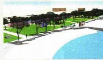
Za projekt uređenja plaže Hidrobaza 1,5 milijuna kuna bespovratno

U lipnju ove godine na temelju programa Fonda za razvoj turizma kojeg provodi Ministarstvo turizma RH, Gradu Puli dodijeljen je najviši iznos bespovratnih potpora od čak 1,5 milijuna kuna za nastavak projekta uređenja plaže Hidrobaza. Dobivena bespovratna sredstva Ministarstva turizma iskoristit će se za uređenje više operativne obale mornaričke zrakoplovne postaje Hidrobaza koja ima izniman turistički potencijal, a koja je danas, nažalost u zapuštenom i ruševnom stanju.