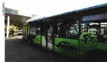
Izgradnja punionice prirodnog plina i nabavka autobusa

rati Grad Pula. Usporedno s obnovom te zgrade, Grad Pula je formirao operativni tim, a u narednom periodu predstoji izrada detaljnog budžeta za realizaciju projekta "360° 3D history mapping" za što će se aplicirati prema najčešćim sredstava iz EU fondova, iznio je nekoliko novosti Miletić.