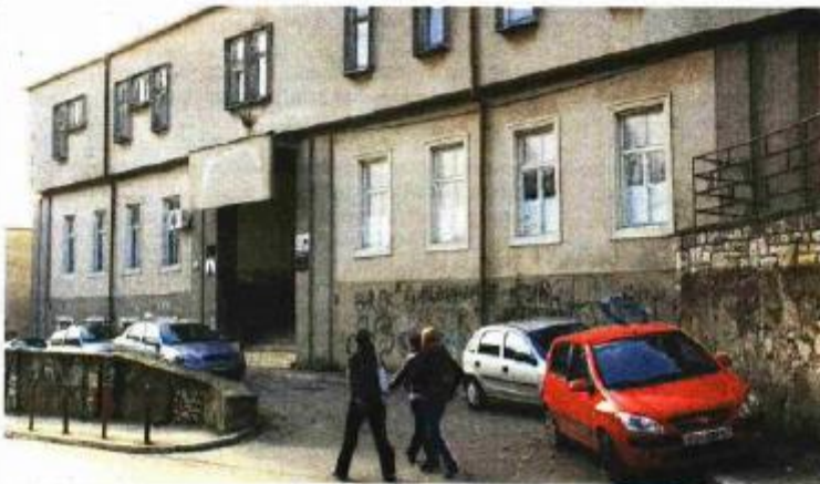
Dječji kreativni centar ući će u program energetske obnove zgrada