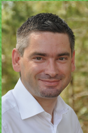
Grad Pula Città di Pola City of Pula