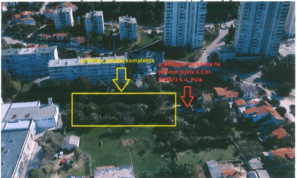
Pogled na lokaciju sa zapada, google earth preglednik

Prilog: Procjembeni elaborate tržišne vrijednosti zemljišta I kategorije u zoni